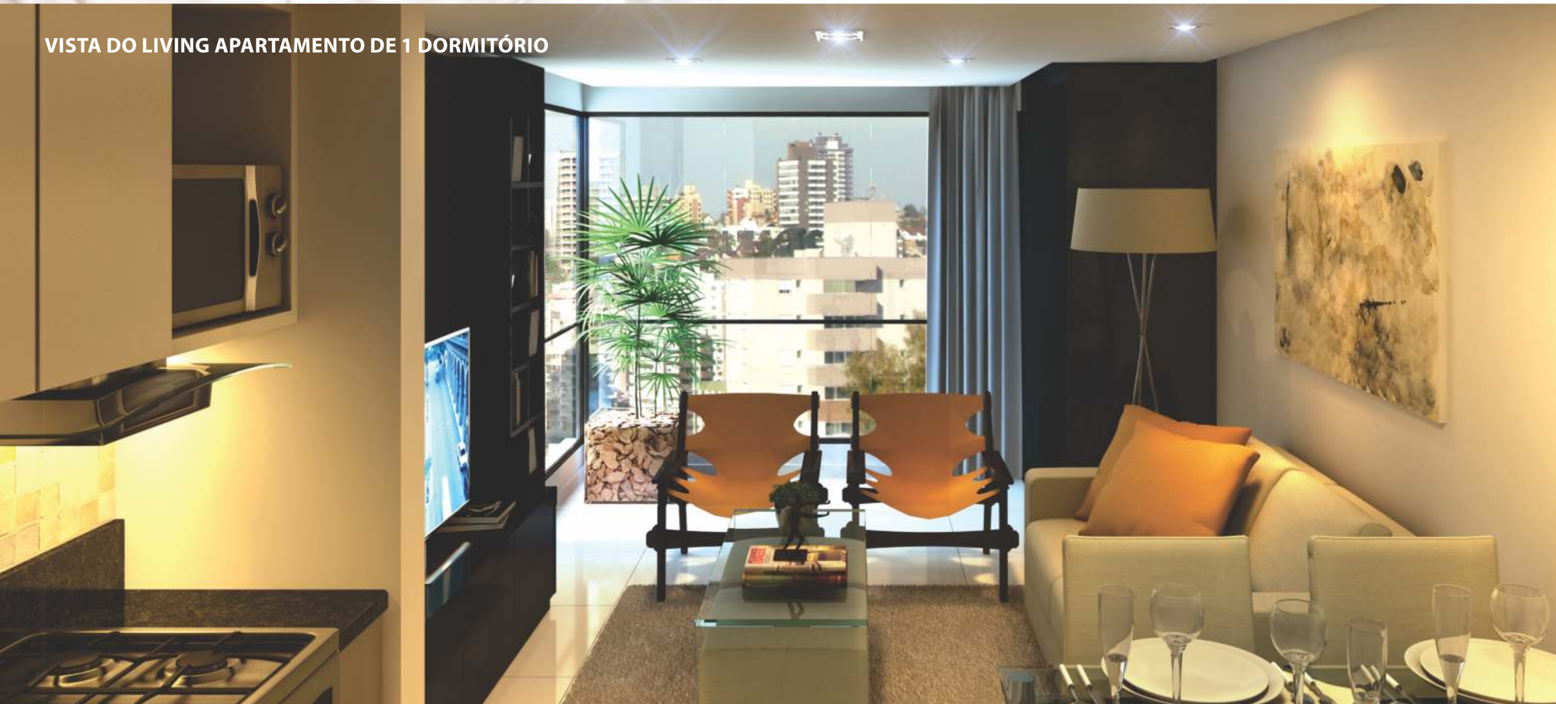
VISTA DO LIVING APARTAMENTO DE 1 DORMITÓRIO

FINAL 05 ÁREA PRIVATIVA: 50,17m 2 ÁREA TOTAL: 68,95m 2