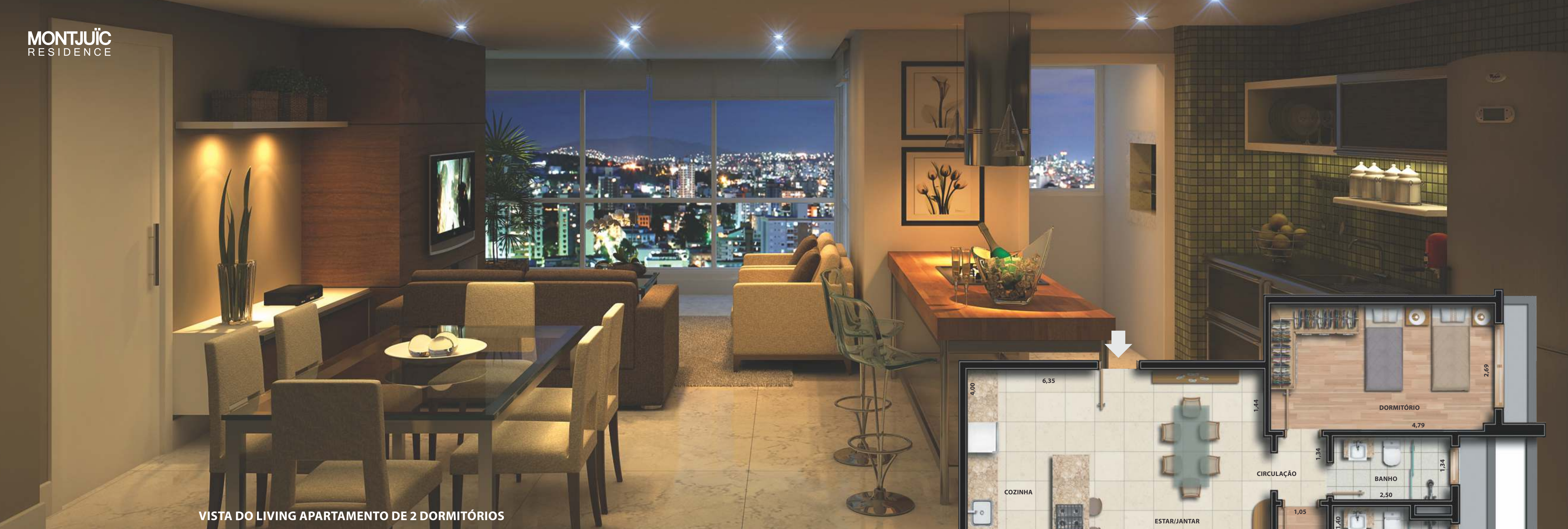
VISTA DO LIVING APARTAMENTO DE 2 DORMITÓRIOS